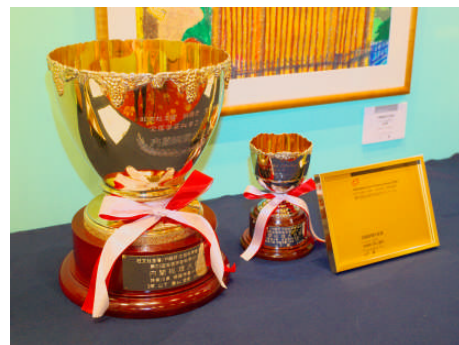
内閣総理大臣賞大カップと楯