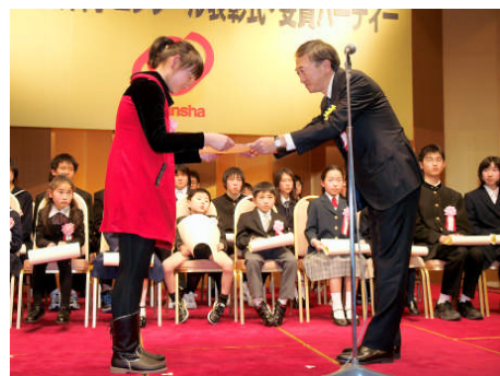
中国からの受賞者