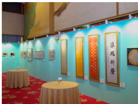
表彰式会場に展示された受賞作品