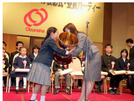
内閣総理大臣賞 大カップ授与

全国学芸科学コンクールは中国との文化交流を目的に、中国の出版社「中国少年児童新聞出版総社」が主催する各種コンクールの上位入賞作品の特に優秀なものに対して、「旺文社社長賞」の授与も行っております。第53回表彰式にも、本賞を受賞した生徒が2名、中国から出席しました。