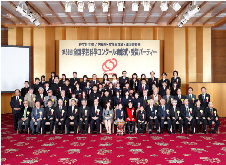
第53回表彰式にて金賞受賞者と審査員、授与の先生がた

全国学芸科学コンクールは中国との文化交流を目的に、中国の出版社「中国少年児童新聞出版総社」が主催する各種コンクールの上位入賞作品の特に優秀なものに対して、「旺文社社長賞」の授与も行っております。第53回表彰式にも、本賞を受賞した生徒が2名、中国から出席しました。