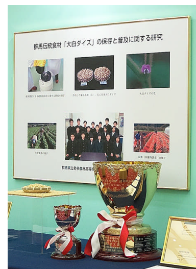
内閣総理大臣賞大カップ