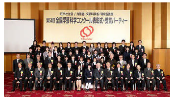
第54回表彰式(ホテルオークラ東京にて)