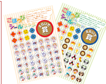
やる気アップの 特典がいっぱい!