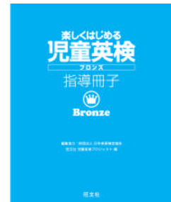
保護者向け指導冊子

「児童英検」の学習参考書や問題集はこれまでも複数出版されていますが、今回、旺文社より刊行する2冊は、家庭での英語学習に焦点を当てた構成とし、保護者が簡単・丁寧に指導できる「指導冊子」付きとなりました。