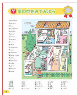
見やすい4色フルカラー